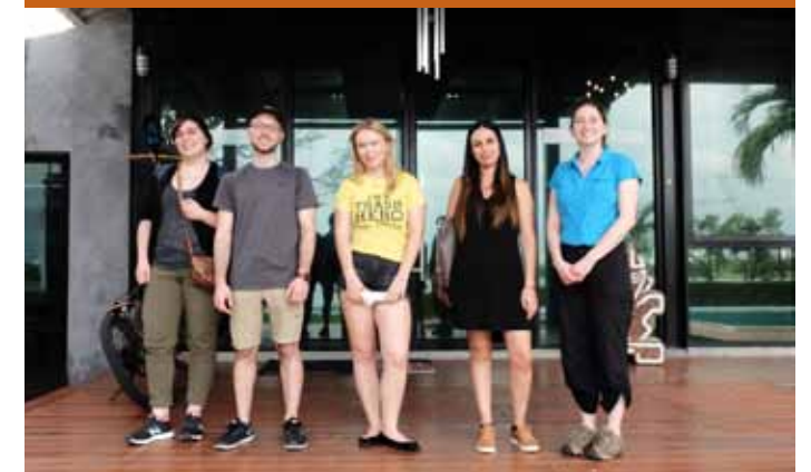
Nos étudiants en séjour d'études à Bangkok grâce au fonds MSDL.