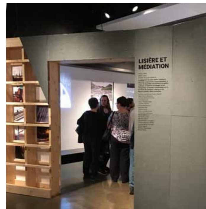
Exposition des finissants de la Faculté de l'aménagement (EFAA2018)

Un autre thème sera offert à l'hiver 2019 sur la ville durable sous la responsabilité de Daniel Pearl .