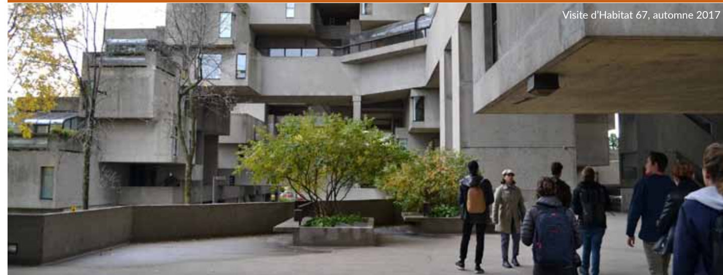
Visite d'Habitat 67, automne 2017