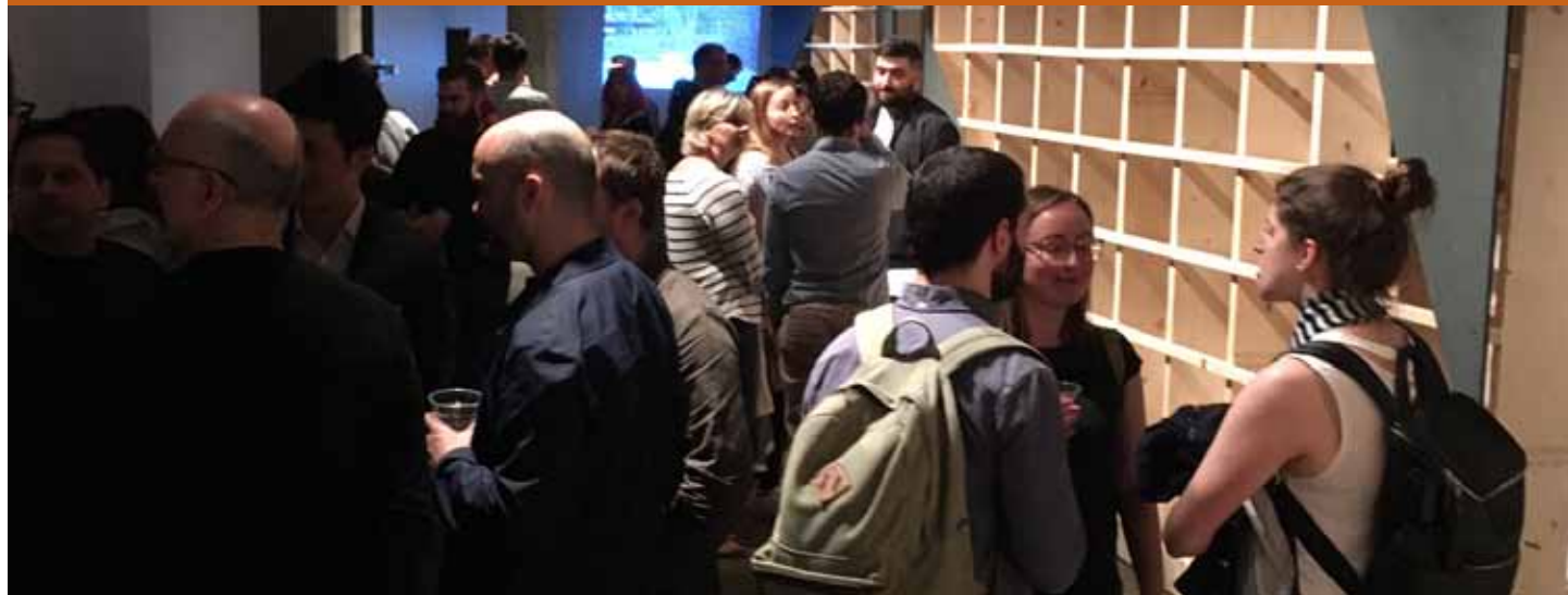
Vernissage de l'exposition des finissants EFFA2018