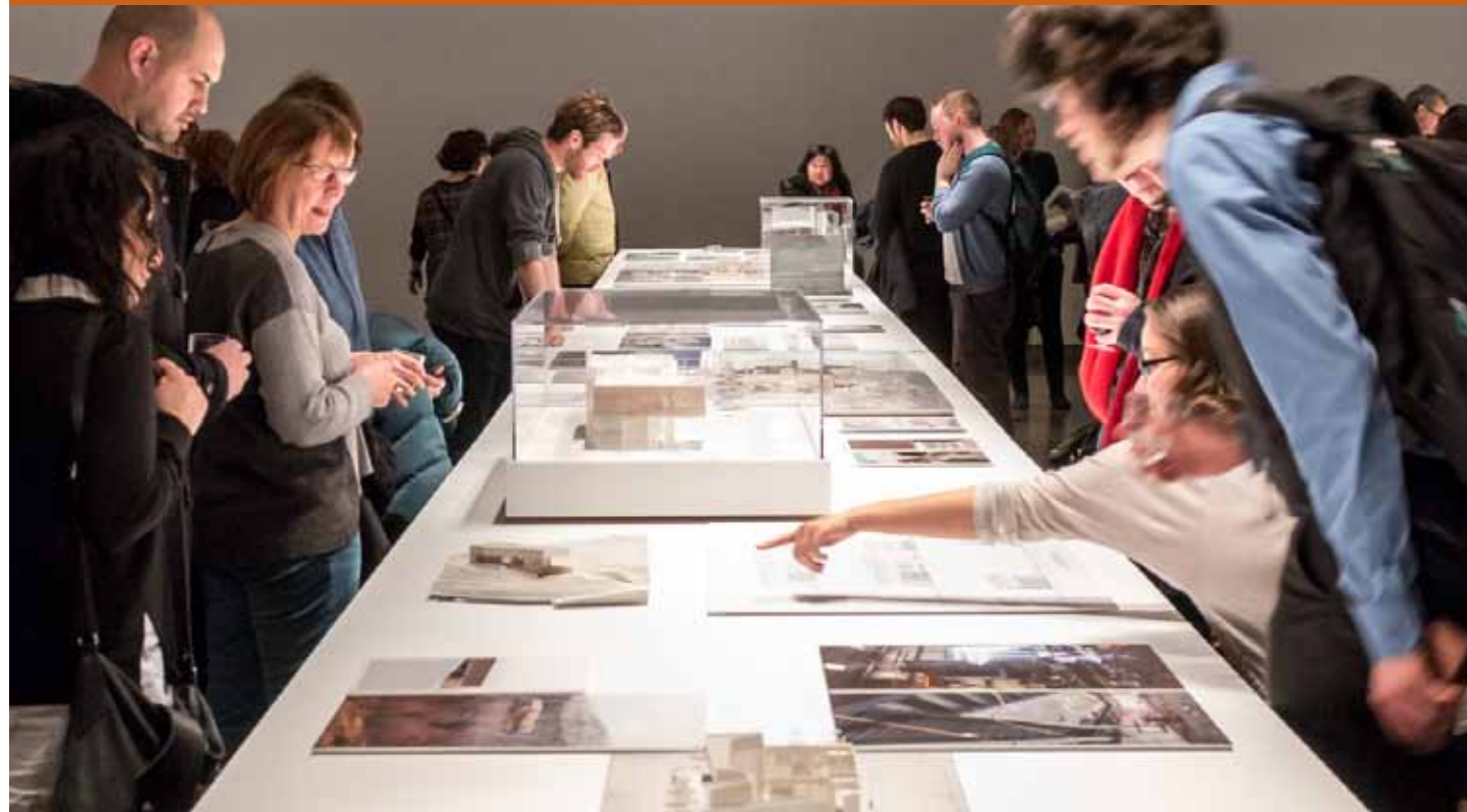
Vernissage de l'exposition Références croisées Chevalier Morales architectes présentée du 31 janvier au 3 mars 2018 au Centre d'exposition de l'Université de Montréal (CEUM). Ces diplômés de l'École ont d'ailleurs reçu le Grand Prix d'excellence 2017 et le Prix d'excellence dans la catégorie Bâtiments culturels de l'Ordre des architectes du Québec pour la Maison de la littérature, réalisée à Québec en 2016.

Notre école est un milieu extrêmement dynamique que le présent rapport annuel veut commémorer. Au cœur de notre mission, il y a les étudiants qui se consacrent pleinement dans une formation exigeante, mais passionnante. On souhaite qu'ils trouvent dans nos murs l'amour de la discipline. Le Regroupement des étudiants et étudiantes en architecture (RÉA) fait en sorte que les étudiants sont partie prenante de cet objectif. Mais pour y arriver, un nombre impressionnant de professeurs, professeurs invités, chargés de cours, chargés de formation pratique, critiques invités, conférenciers et consultants contribuent à la qualité de l'enseignement que nous offrons. Par ces multiples engagements, l'École entretient des liens étroits avec le milieu professionnel. Le résultat se reflète dans les accomplissements de nos étudiants, lors de l'exposition des finissants, ou lorsqu'ils se distinguent à des concours ou des charrettes, ce qui nous remplit de fierté.